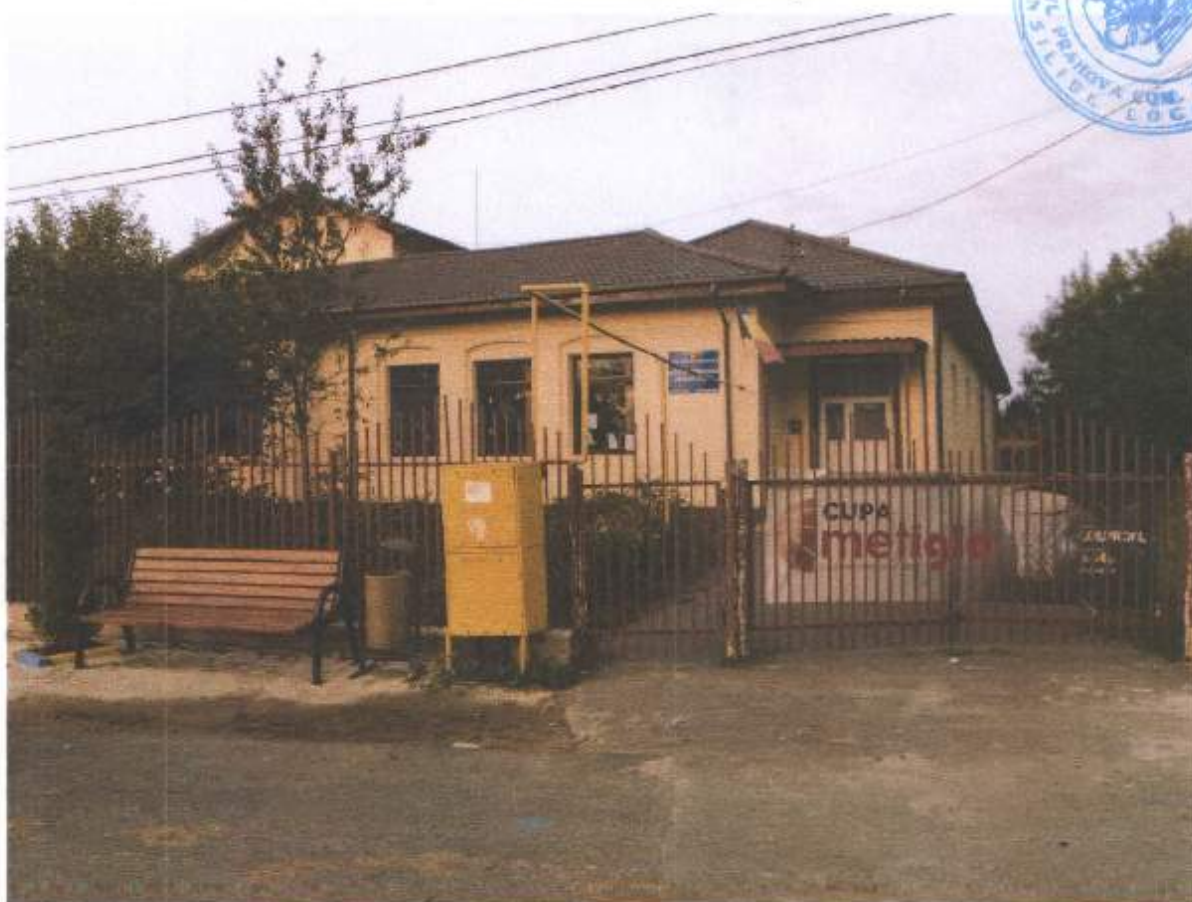
Foto. Sediul Consiliului local din comună Plopu